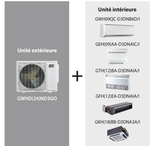
Tableau des combinaisons 1

Combinaison d'unités intérieures choisie : 09 + 09 + 12 + 12 + 18